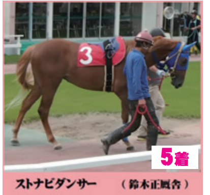
5着 スナビダンサー (鈴木正厩舎)