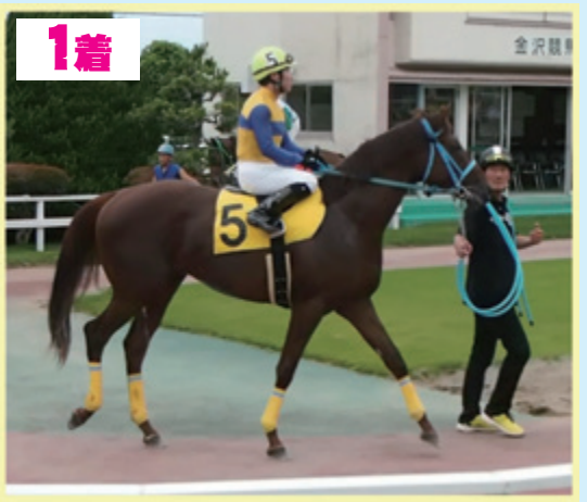
1着 フジヤマブシ (黒木厩舎)