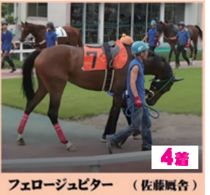
4着 フェロージュピター (佐藤厩舎)

【レース回顧】 1着 ⑤フジヤマブシ は能検の2度とも大きく出遅れおり、”900mでは不利”との見方が大勢。パドックでは時折りテンションの高い処も見せ、その点でも7番人気も当然? 案の定スタートで4馬身ほど出遅れる。道中更に離され向正面で8馬身余り。到底間に合う印象ではなかったが、そこから大外を廻りグイグイ追い上げ。4角では先頭④との差は4馬身。長く脚を使わされたが、直線もしっかり伸び差し切った。 2着 ④シュネルン はスタート良く飛び出す。道中⑧に並び息を入れる処が無かったが、4角振り切って逃げ込みを図る。勝ち馬にゴール前で交されが、走力の高さを示した。 3着①ハクサンホーリー は1枠で先入れ。待たされた事でゲート内でソワソワし出す。その影響かゲートが開いてから加速が今一つ。ラチ沿いの砂の深いコースを走らされたのも痛かった。4角外に出して、そこからジリジリ詰めたが…。1枠が災いした印象。