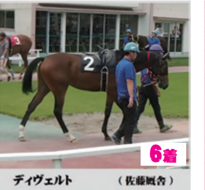
6着 ディヴェルト (佐藤厩舎)