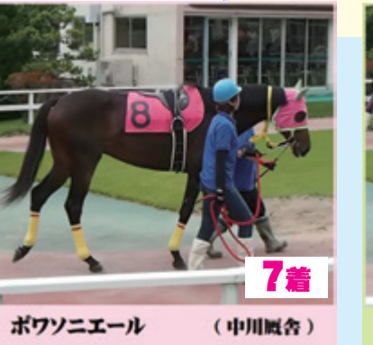
7着 ポワソニエール (中川厩舎)