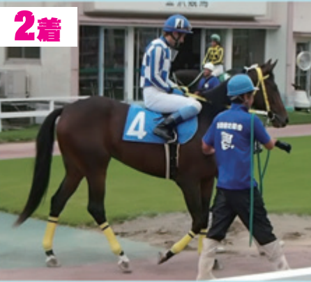
2着 シュネルン (高橋俊厩舎)