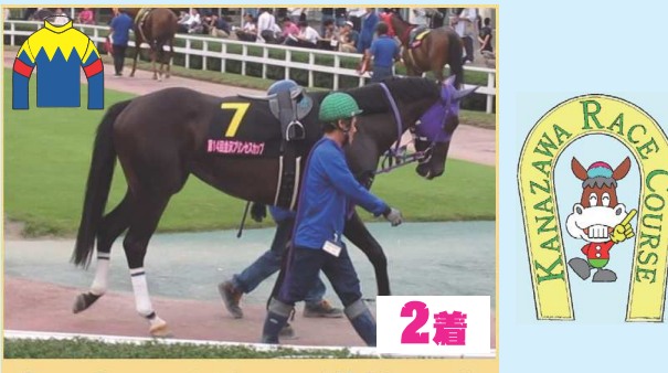
2着 ドンナフォルテ (金田厩舎)