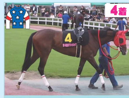
4着 グラムデイジー (金田厩舎)

【レース回顧】 1着 ③ハイタッチガール は好発を決め先手。7枠2頭が馬体を寄せてくるが、前走とは一変して平均的な流れ。4角手前から押し出すと、直線では一気に後続を引き離し圧勝で重賞制覇を果たした。2着 ⑦ドンナフォルテ は予定通り③マークの2番手。プレッシャーを掛けつつ進むが、4角手前から手応えが怪しくなる。完成度の差が出た印象も、直線はよく踏ん張った。3着 ⑩ミライヘノトビラ +7は歓迎。好位外からじっくり溜める作戦。一杯になった馬を交わした程度も、時計も詰め成長を感じた一戦だった。4着 ④グラムデイジー はしっかりと追い切りを敢行しての参戦。ただ、内枠。後方から外を回らされる展開。ペースを思うと2重のハンデだったか。勝ち馬を除けば上り最速。時計も詰め、地力を付けた印象。5着 ⑨マロンブランド は外から積極的に前を追う展開。勝負所から動けなかったのは今の力関係かも。