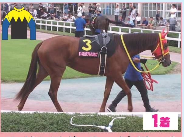
1着 ハイタッチガール (中川厩舎)