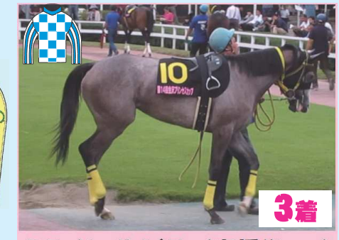
3着 ミライヘノトビラ (高橋俊厩舎)