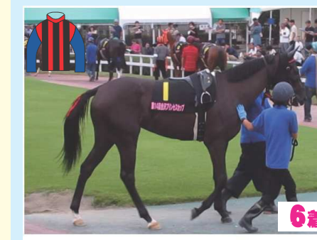
6着 チョウマイモン (金田厩舎)

上位人気3頭③⑥⑦に転入馬②も不気味な存在。ひと波乱あっていいだろう。外枠活かせる⑦有力。 18点 佐々木英允 ◎⑦ 1着 2着 3着 ○⑥ ▲③ 7 6 → 7 6 → 7 6 3 △② 3 → 3 → 2 4 △④