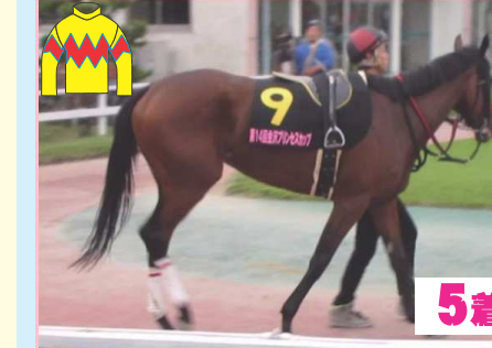
5着 マロンブランド (金田厩舎)

【レース回顧】 1着 ③ハイタッチガール は好発を決め先手。7枠2頭が馬体を寄せてくるが、前走とは一変して平均的な流れ。4角手前から押し出すと、直線では一気に後続を引き離し圧勝で重賞制覇を果たした。2着 ⑦ドンナフォルテ は予定通り③マークの2番手。プレッシャーを掛けつつ進むが、4角手前から手応えが怪しくなる。完成度の差が出た印象も、直線はよく踏ん張った。3着 ⑩ミライヘノトビラ +7は歓迎。好位外からじっくり溜める作戦。一杯になった馬を交わした程度も、時計も詰め成長を感じた一戦だった。4着 ④グラムデイジー はしっかりと追い切りを敢行しての参戦。ただ、内枠。後方から外を回らされる展開。ペースを思うと2重のハンデだったか。勝ち馬を除けば上り最速。時計も詰め、地力を付けた印象。5着 ⑨マロンブランド は外から積極的に前を追う展開。勝負所から動けなかったのは今の力関係かも。